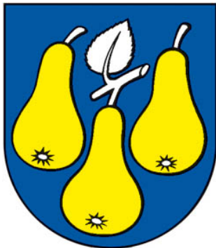
Príloha 1: erb obce